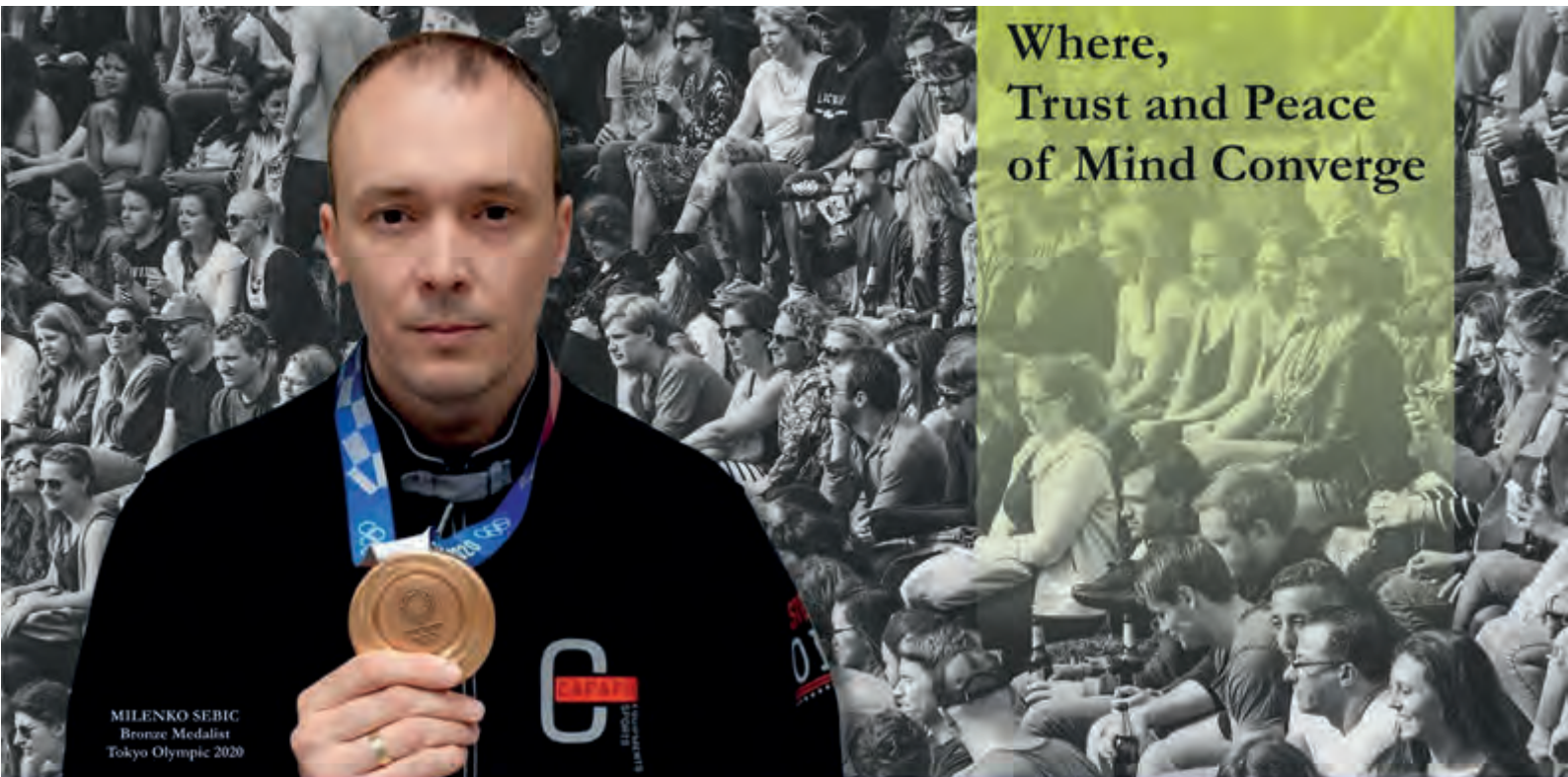
MILENKO SEBIC Bronze Medalist Tokyo Olympic 2020

Anmeldung über den BSSB-Onlinemelder Bereich „Jugend“: www.bssb.de/aus-und-weiterbildung.html